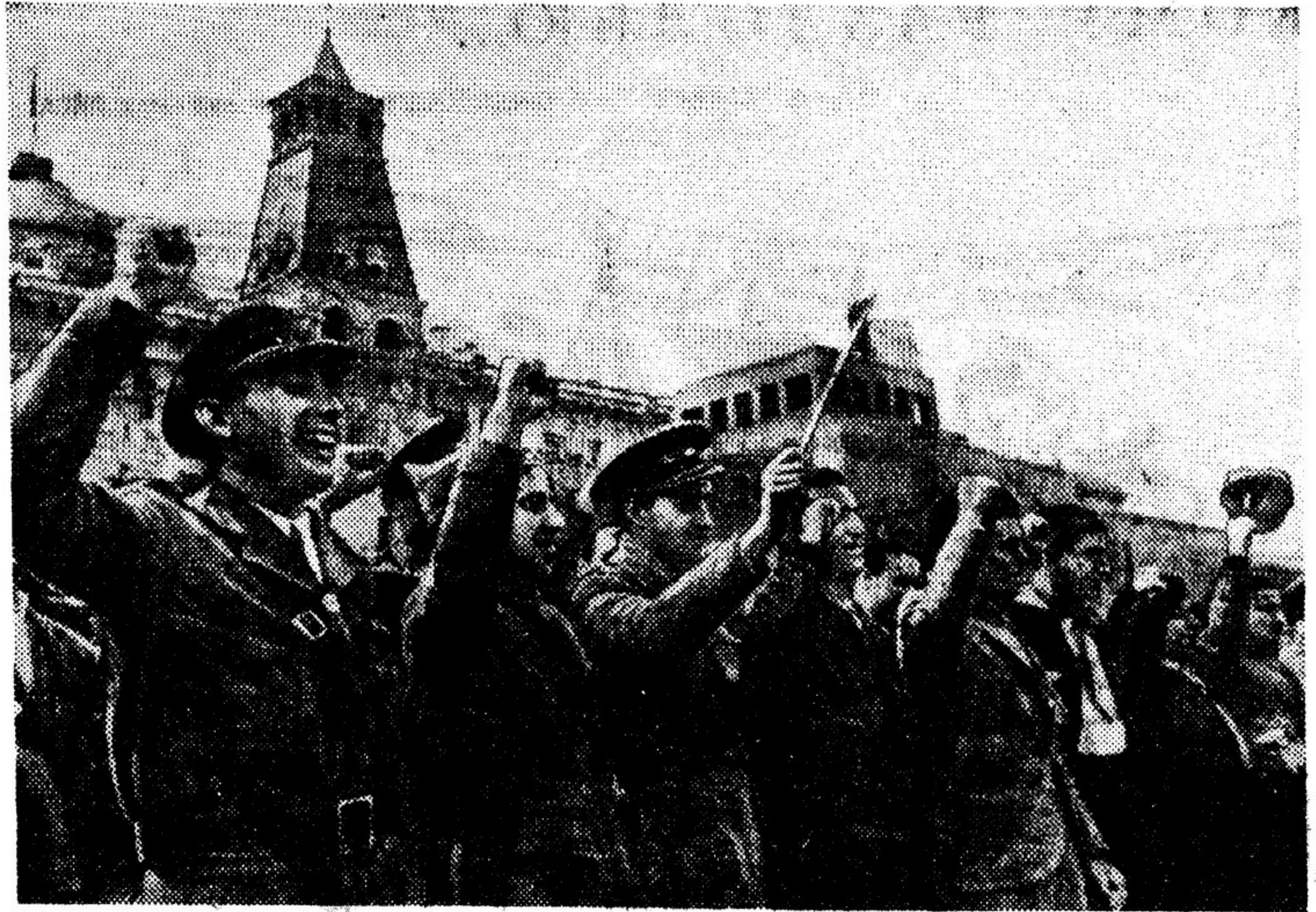
Делегаты республиканской Испании на Красной площади 1 мая.