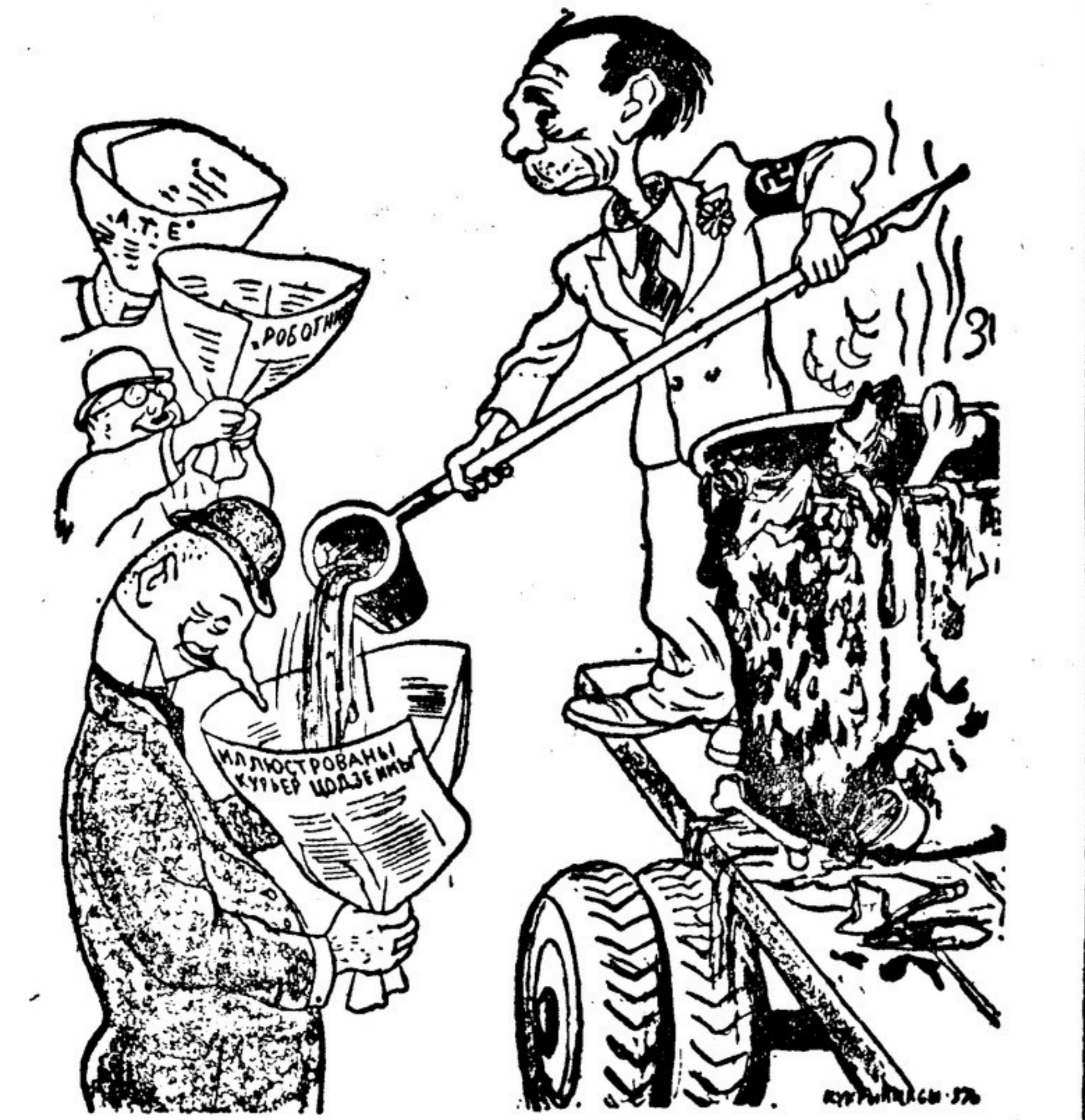
«Новости из свежего источника». Рисунок художников Кукрыниных («Правда» от 13 февраля 1937 г.)