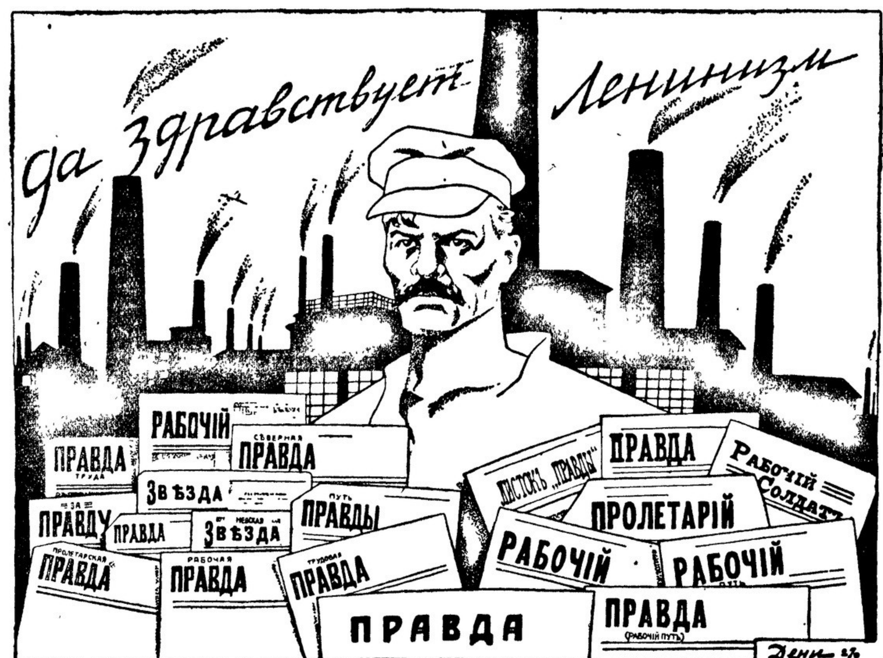
«Путь «Правды». Рисунок Дени к пятидесятилетию «Правды» (1927 г.)

Работая в «Правде», отчетливо ощущаешь, что ты связан с читателем, который тебя любит, который за твоей творческой жизнью следит, который о тебе заботится куда больше наших журнальных редакторов, не говоря уже о критиках. На юге и севере Союза, в Солнечногорске и в Фергане, я видел, с какой жадностью набрасываются люди на свежие номера «Правды». И сознание того, что и я, хотя бы в небольшой мере, участвую в работе «Правды», наполняло меня гордостью. Мне лично сотрудничество в «Правде» принесло огромную пользу. В день юбилей «Правды» мне хочется торжественно приветствовать нашу родную газету. Ленинград. (Передано по телеграфу).